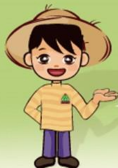
イメージキャラクター ミズホ君